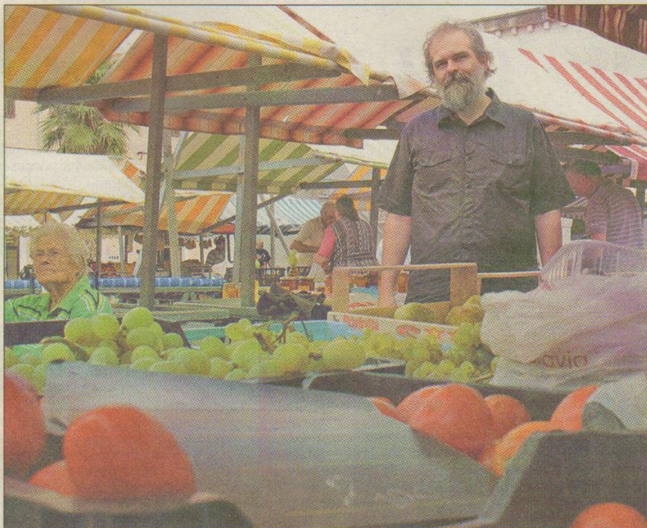
“Družbo bi bilo mogoče zasnovati tako, da bi ohranili pojem menjave, a na prvo mesto namesto dobička postavili solidarnost in vzajemnost.”