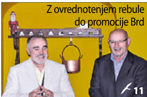
Z ovrednotenjem rebule do promocije Brd