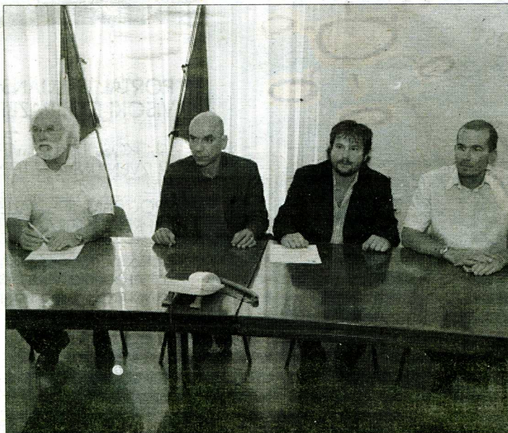
Tiskovna konferenca leve sredine v občinskem svetu